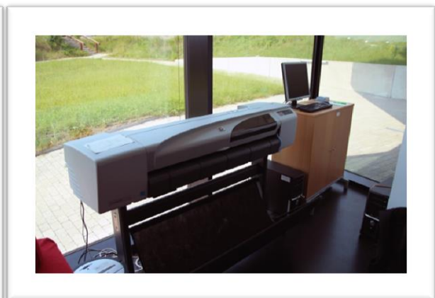
...und der Plotter im ÖH-Büro

Einen Eindruck davon, in welchem Ausmaß die diversen Serviceleistungen im letzten Jahr in Anspruch genommen wurden, vermittelt euch die folgende statistische Aufstellung 1 :